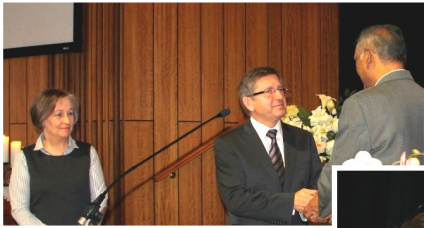
27 October 2012