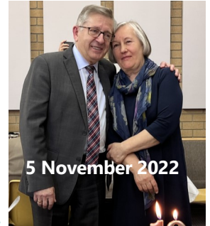
5 November 2022