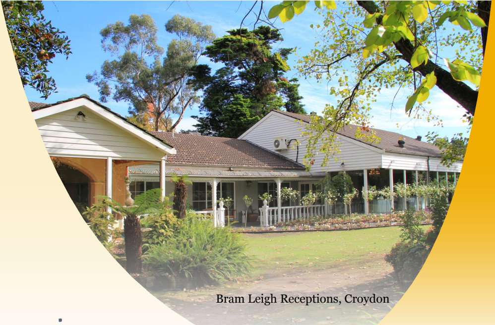
Bram Leigh Receptions, Croydon

Życzymy wszystkim miłego Sabatu Happy Sabbath to All!