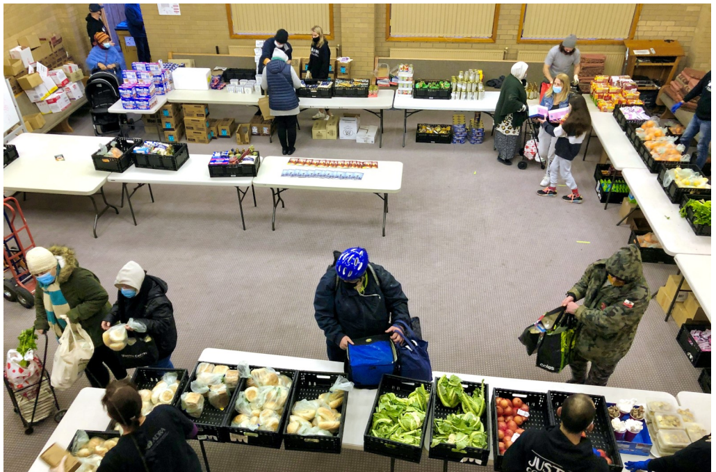
ADRA w akcji podczas lockdown / ADRA in action during lockdown