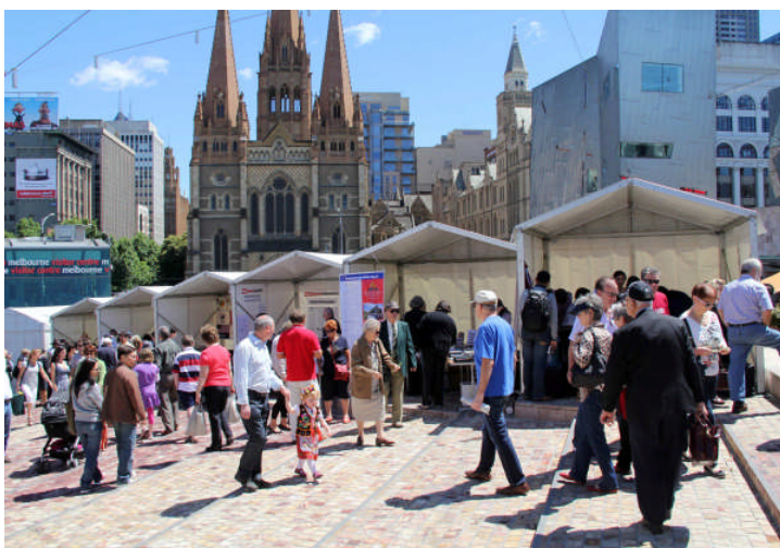
Federation Square, Melbourne