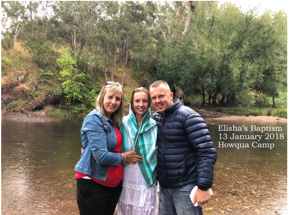
Elisha's Baptism 13 January 2018 Howqua Camp