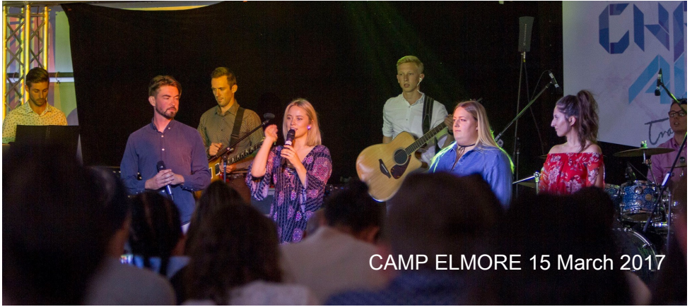
CAMP ELMORE 15 March 2017