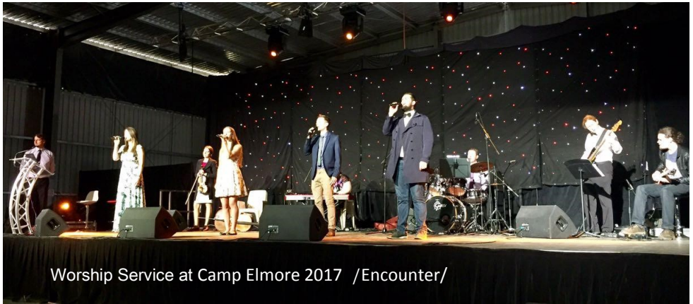
Worship Service at Camp Elmore 2017 /Encounter/