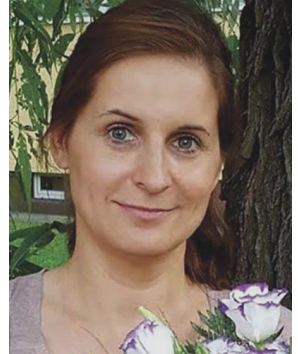
Dorota, kobieta z czytanki misyjnej Dorothy from the Mission story