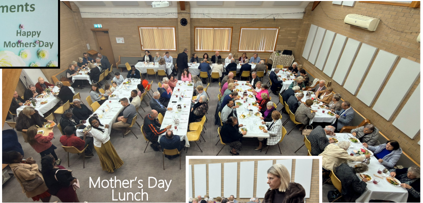
Mother's Day Lunch